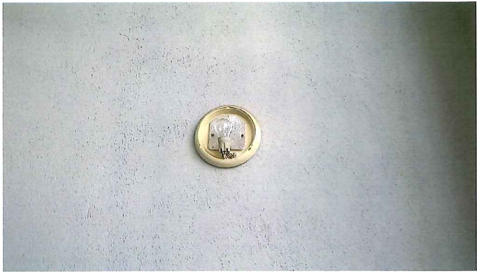
13 pav. Sieninis šviestuvas neturi gaubto