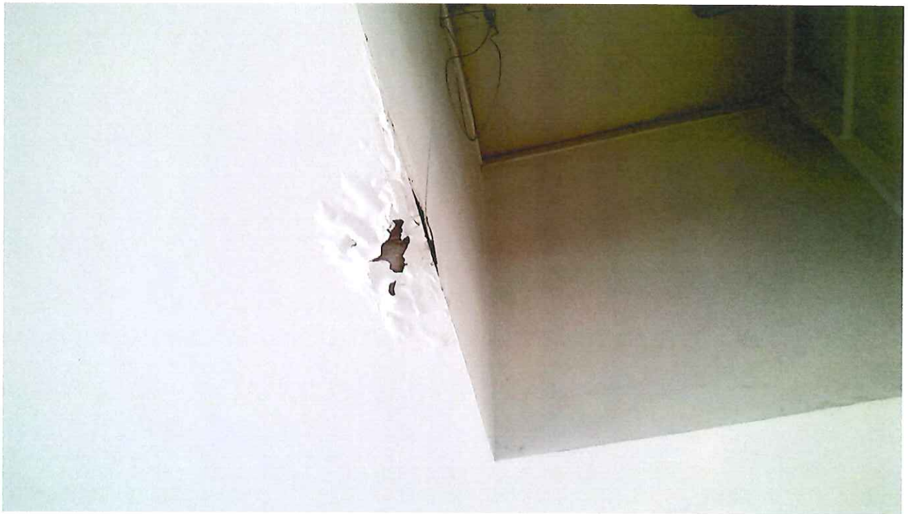
10 pav. Dėl nesandaraus stogo liuko drėgmė pažeidė lubų apdailą