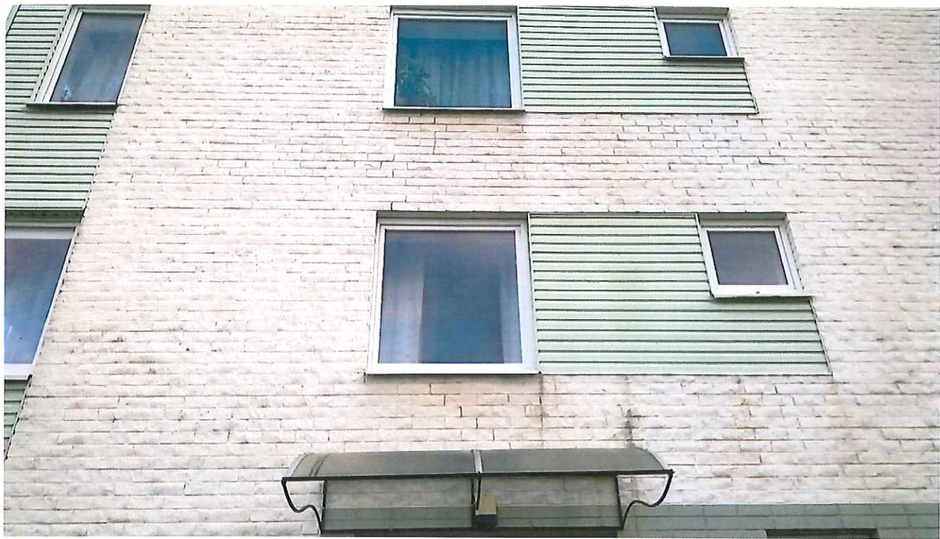
11 pav. Fasade atsivėrę plyšiai apdailiniame mūre