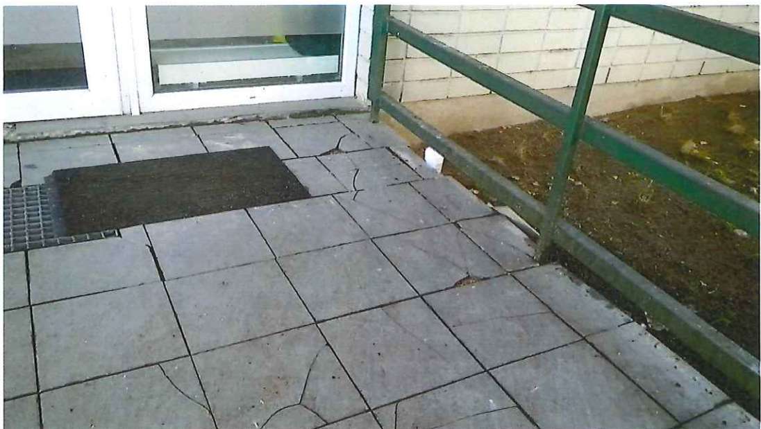
15 pav. Suskilinėję laiptų aikštelės keraminės plytelės