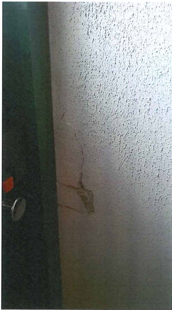
12 pav. Nuskelta vidaus sienos apdaila laiptinėje