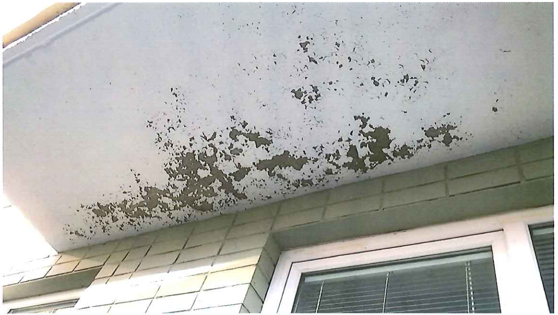
7 pav. Nukritę balkono plokštės dažai