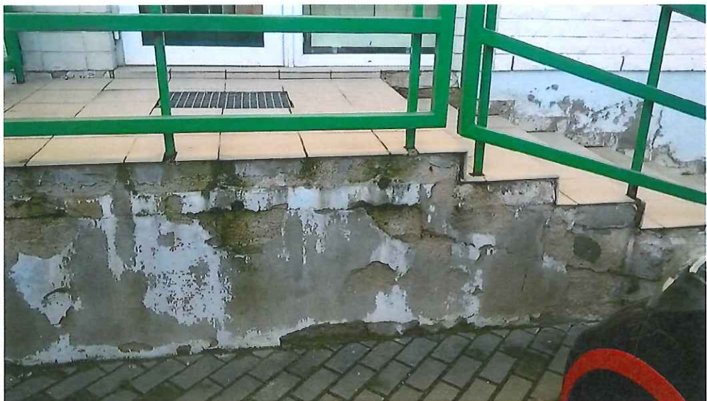
14 pav. Sutrūkinėjusi ir aptrupėjusi lauko laiptų betoninė siena