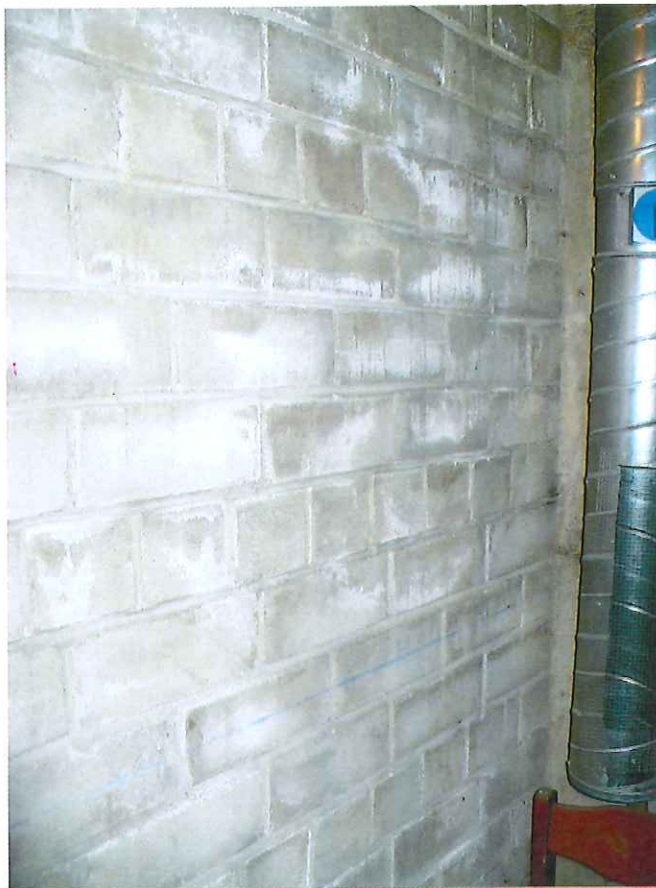
8 pav. Garažo pertvaroje bėgantis vanduo išplovė mūro mišinio druskas