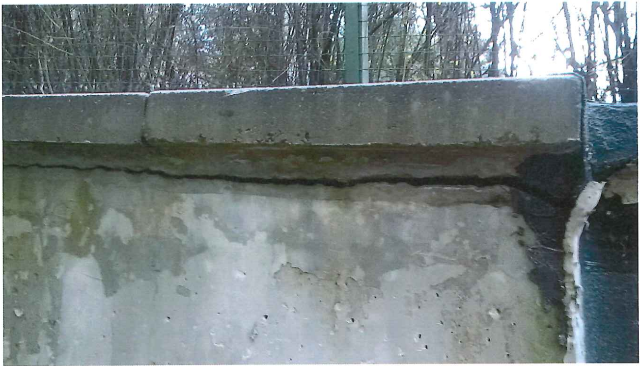
14 pav. Atsivėręs plyšys po sieną dengiančiomis betoninėmis plytelėmis