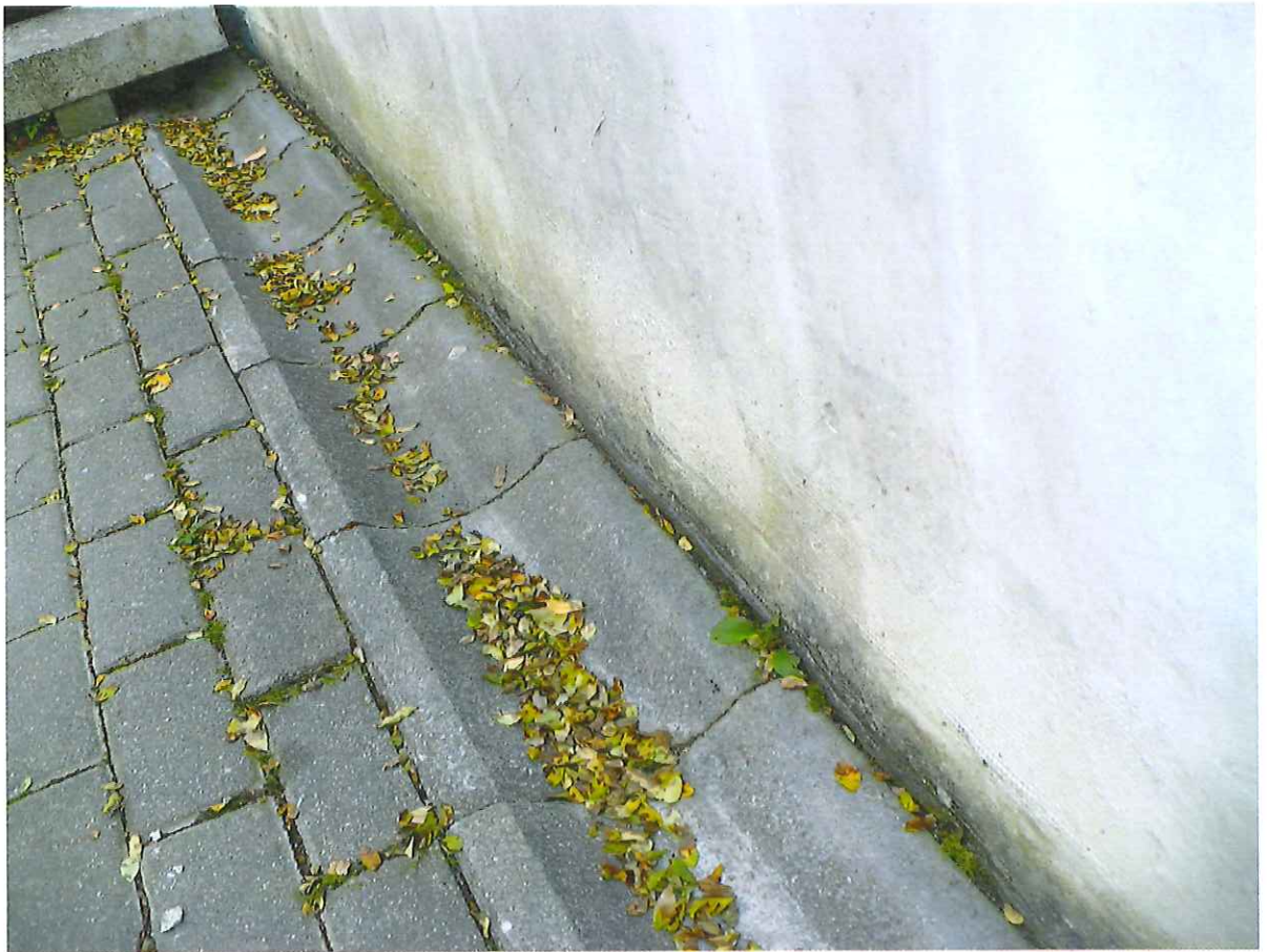
9 pav. Nesandarus tarpas tarp sienos ir vandens latakų