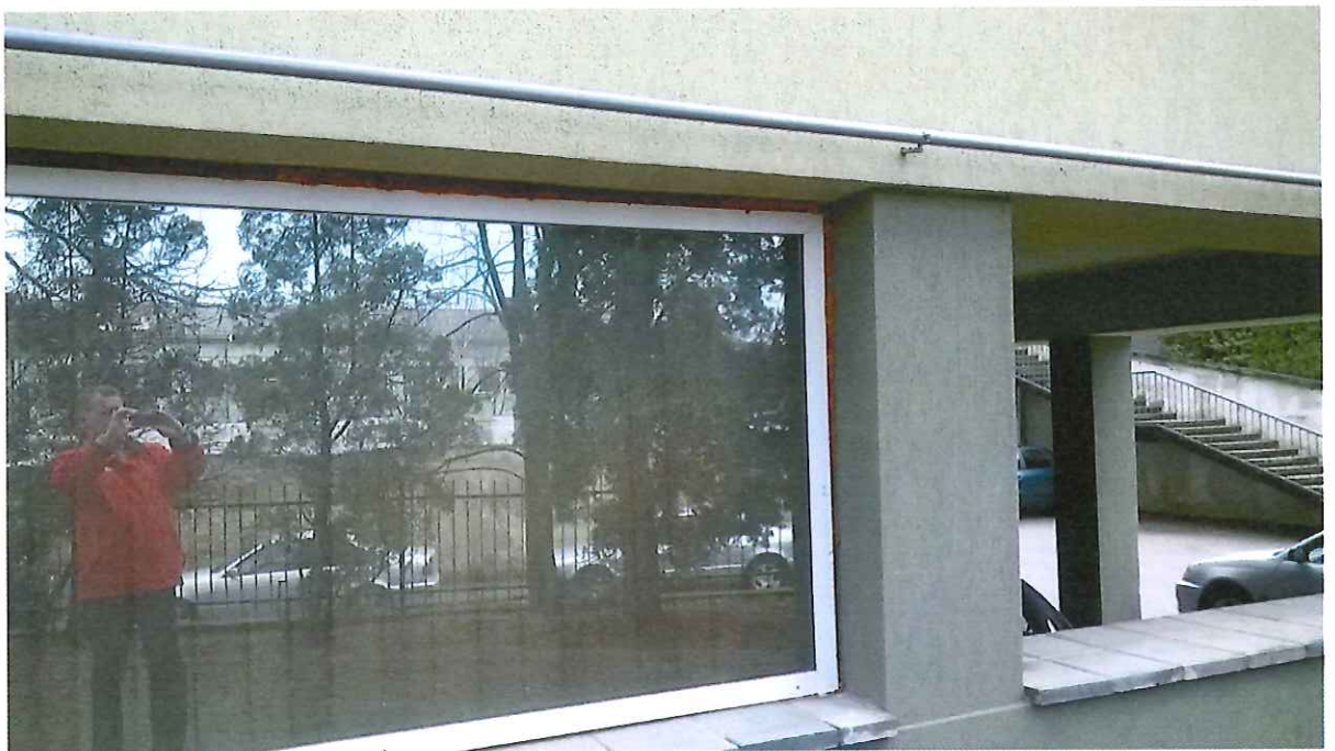
15 pav. Neuždengtos sandarinimo putos