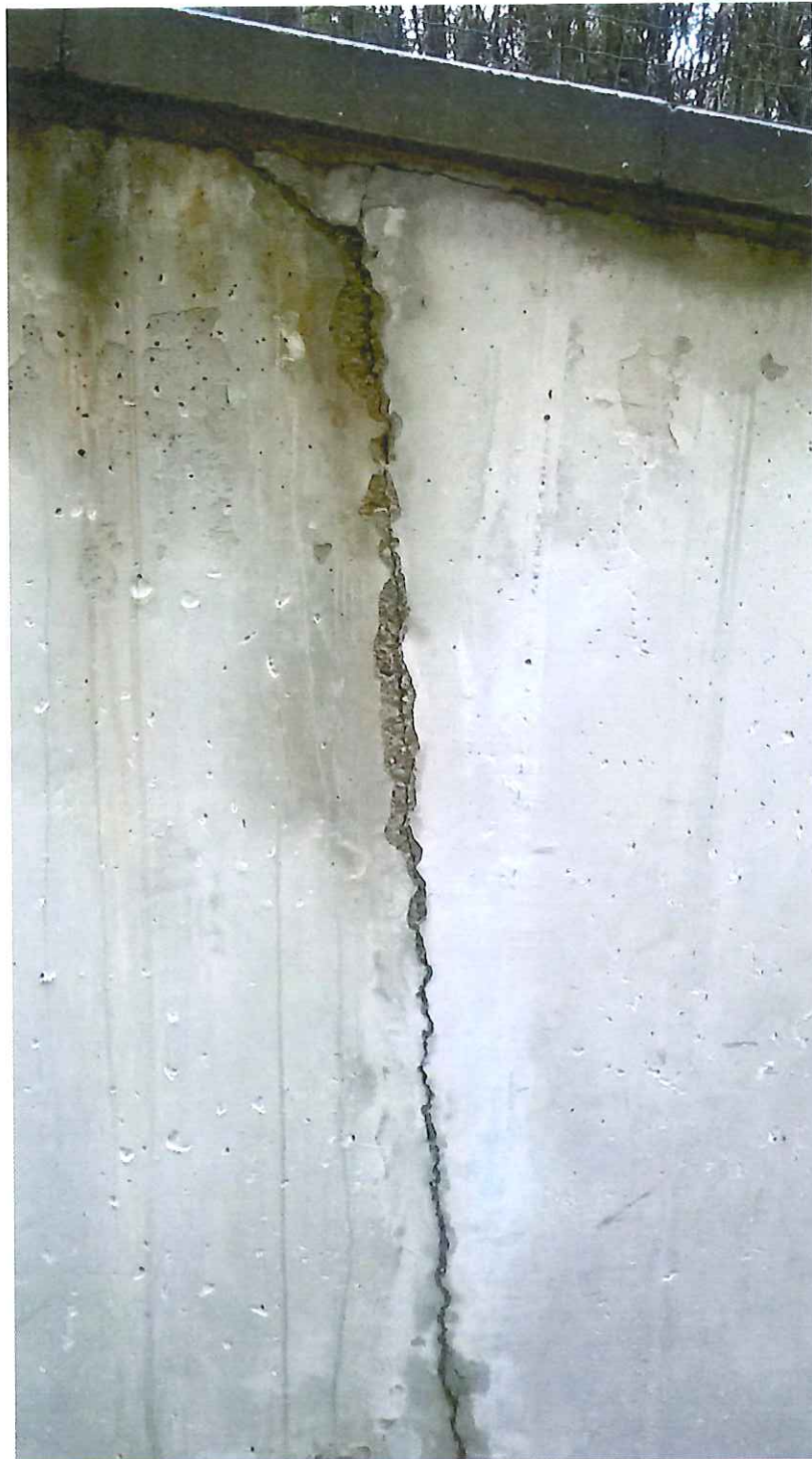
10 pav. Skilusi atraminė siena