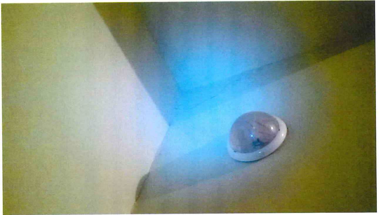
12 pav. Skilusi siena ir atsivėręs plyšys tarp sienos ir perdangos